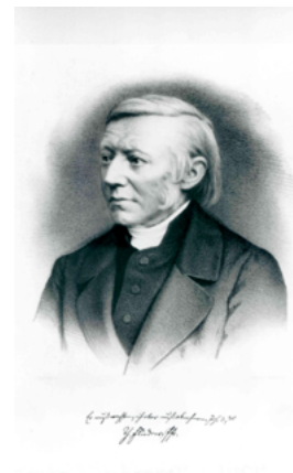
Theodor Fliedner (1800 - 1864), Gründer der Kaiserswerther Diakonie, evangelischer Pastor, Sozialreformer

Theodor Fliedner hatte das Ziel, die Diakonissen „für ihre Wirksamkeit in der Armen- und Krankenpflege so aus(zu)bilden und (zu) üben, dass sie mit einem Schatz praktischer Erfahrung und technischer Übung ausgestattet sind, welche sie befähigt, mit Umsicht und Weisheit die Armen- und Kranken-Verhältnisse zu behandeln und welche diese Wirksamkeit zu ihrem Lebensberufe zu machen begehren“. (Theodor Fliedner, Diakonatsgutachten (1856), S. 121)